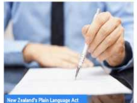
New Zealand's Plain Language Act

(A) न्यूजीलैंड की संसद ने एक कानून पारित किया है जो नौकरशाहों को जनता के साथ संवाद करते समय अकथनीय और जटिल भाषा का उपयोग करने से रोकता है। इस अधिनियम का उद्देश्य लोकतंत्र को अधिक समावेशी बनाना है, विशेष रूप से गैर-देशी अंग्रेजी बोलने वालों, विकलांग लोगों और कम शिक्षित लोगों के लिए।